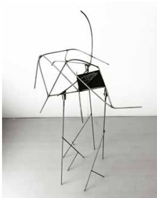
Trappola, 2022 fotoceramica, acciaio inox, dimensioni variabili

Spesso mi confronto con entrambe le tematiche, quella intima e quella sociale. L'immagine fotografica è portatrice di emozioni, espressioni anche di un vissuto personale (indagine introspettiva) e con essa è possibile cogliere il mistero della relazione profonda fra l'uomo e la natura, la scultura invece diventa il mezzo per la creazione di una nuova condizione reale attraverso la sperimentazione di nuovi materiali. Tutto questo rappresenta la principale fonte di stimolo per l'inizio di un nuovo lavoro. L'ispirazione inizialmente è quindi intima, ma nella mia ricerca hanno trovato spazio anche tematiche sociali in particolare sui temi ambientali e sul tema del "femminile". A proposito di quest'ultima tematica uno dei materiali che mi ha ispirato per la realizzazione di nuovi lavori è stata la paglietta in acciaio inox, materiale evocatore di un mondo femminile-domestico, metaforicamente simbolo di